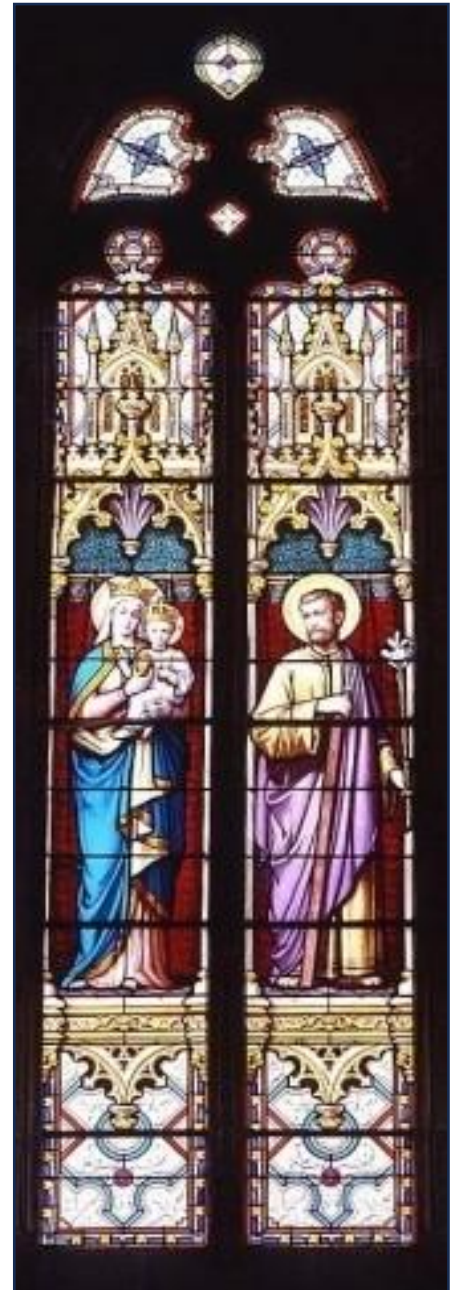
Verrière Vierge à l'Enfant, St Joseph de 1885 réalisé par le peintre-verrier Lucien-Léopold Lobin (Tours)