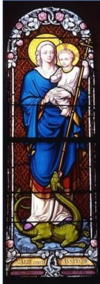
Verrière Vierge à l'Enfant de l'Immaculée Conception de 1865 réalisée par le peintre-verrier Goglet (Paris)