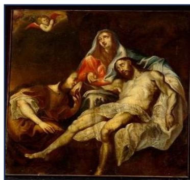
La déploration , peinture à l'huile du XVIIème s réalisée par le peintre Van Dyck Anton