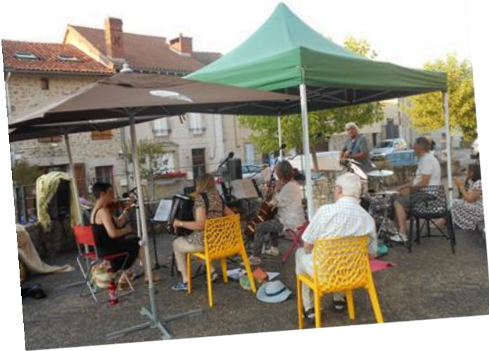
Mercredi 21 Juin : fête de la musique