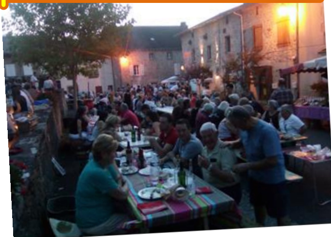
Jeudi 24 août : marché fermier semi-nocturne sur la place de l'église