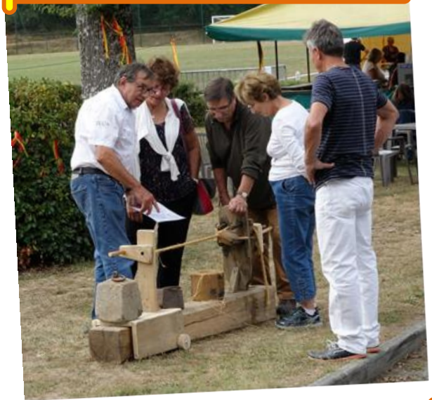
Dimanche 3 Septembre : Perinqueta, organisée par la Maison de Païs