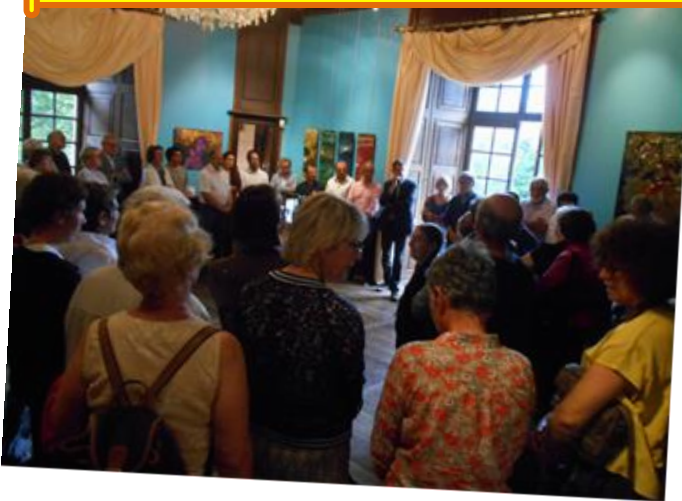
Du 22 juillet au 20 août : exposition au château