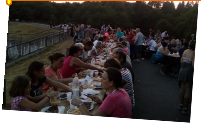
Samedi 24 Juin : randonnée gourmande et feu de Saint-Jean organisés par le comité des fêtes.