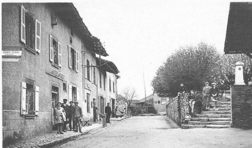
4412. SAINT-AUVENT (Hte-Vienne) — Rue de la Poste - Place des Tilleuls

Inscription sur les listes électorales Page N°3